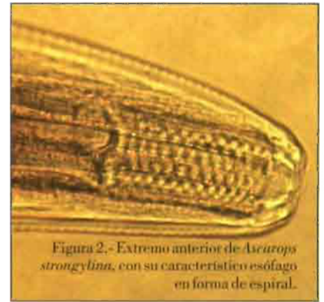
Figura 2.- Extremo anterior de Ascarops strongylina , con su característico esófago en forma de espiral.

Estos parásitos son conocidos vulgarmente como "gusanos hilo" por su pequeño tamaño y su delgadez. El ciclo biológico de Strongyloides se caracteriza por la alternancia de fases de vida libre con fases parásitas, constituidas exclusivamente