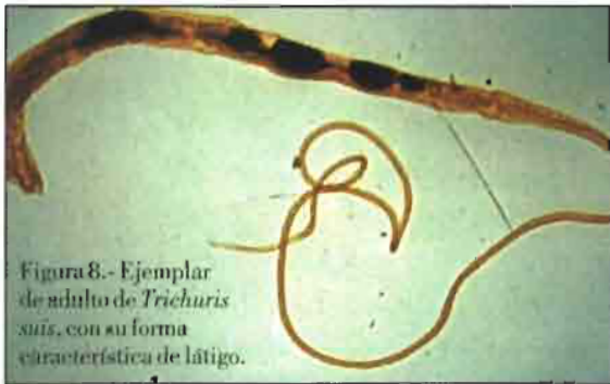
Figura 8.- Ejemplar de adulto de Trichuris suis , con su forma característica de látigo.

Este parásito se localiza, en su forma adulta en el intestino, si bien las formas larvianas se hallan enquistadas en la musculatura. Los machos miden 1,5 mm y las hembras hasta 4 mm. Tiene un ciclo autoheteroxeno. El período prepatente es de unos 2 meses. Estos parásitos prácticamente no desencadenan acción patógena, si bien los adultos podría n originar ligero daño por la acción traumática e irritativa cuando penetran las hembras en las glán-