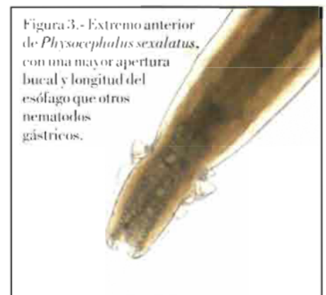
Figura 3.- Extremo anterior de Physocephalus sexalatus , con una mayor apertura bucal y longitud del esófago que otros nematodos gástricos.

por hembras partenogénicas. La principal patogenia la ocasionan las larvas al penetrar la piel, sobre todo en zonas de axilas, braga y/o interdigitales, pudiendo ocasionar algún enrojecimiento, a modo de petequias puntiformes, que no siempre es percibido, pero sensibiliza al animal que sufrirá, en reinfecciones, una dermatitis urticariforme, pruriginosa e incluso con pápulas. En ocasiones, en el intestino se observan erosiones hemorrágicas o úlceras, que pueden derivar en