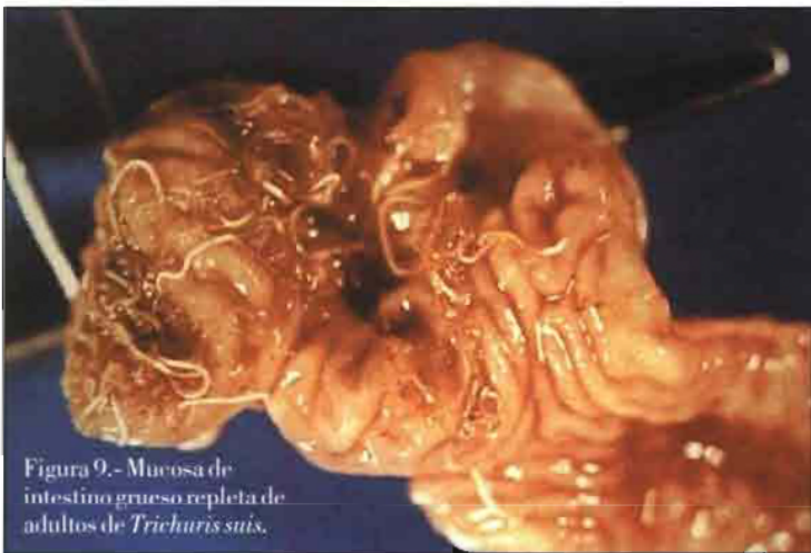
Figura 9.- Mucosa de intestino grueso repleta de adultos de Trichuris suis .

dulas de las criptas. La ligera patogenia de las larvas se produce también de forma mecánica y traumática a su entrada y salida de los capilares y a su penetración al sarcolema.