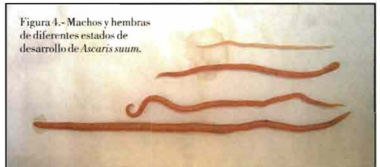
Figura 4.- Machos y hembras de diferentes estados de desarrollo de Ascaris suum .