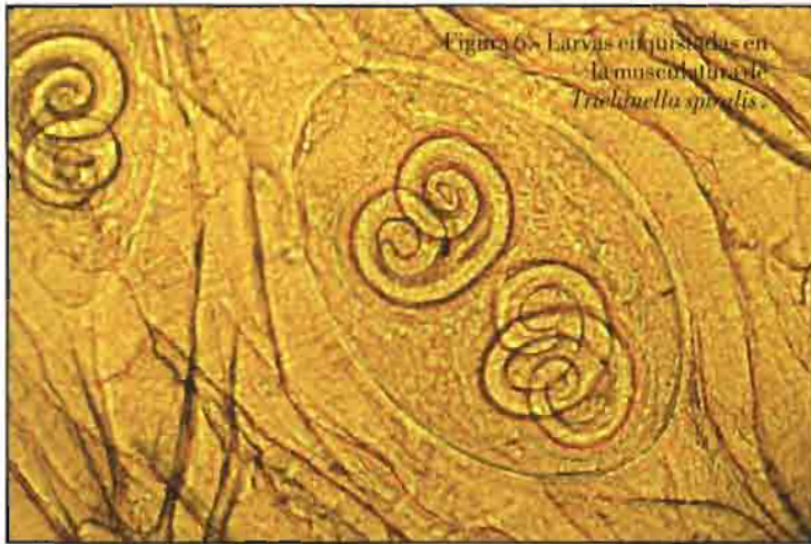
Figura 6.- Larvas enquistadas en la musculatura de Trichinella spiralis .