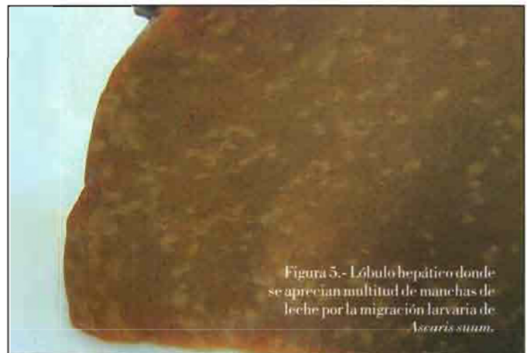
Figura 5.- Lóbulo hepático donde se aprecian multitud de manchas de leche por la migración larvaria de Ascaris suum .

por hembras partenogénicas. La principal patogenia la ocasionan las larvas al penetrar la piel, sobre todo en zonas de axilas, braga y/o interdigitales, pudiendo ocasionar algún enrojecimiento, a modo de petequias puntiformes, que no siempre es percibido, pero sensibiliza al animal que sufrirá, en reinfecciones, una dermatitis urticariforme, pruriginosa e incluso con pápulas. En ocasiones, en el intestino se observan erosiones hemorrágicas o úlceras, que pueden derivar en