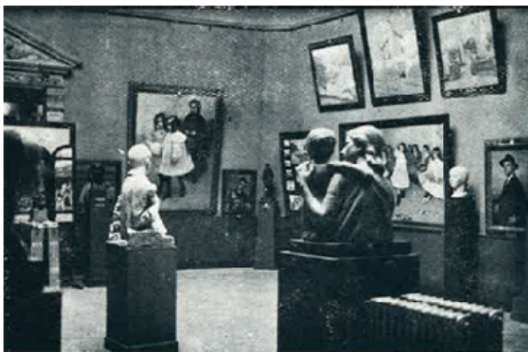
Fig. 9. Salón principal del Museo de Bellas Artes de Badajoz en 1951, otro aspecto de la sala. Imagen publicada en la revista Mundo Ilustrado , n.º 98, 1951, p. 2.