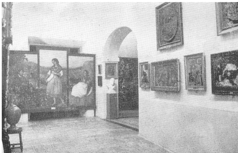
Fig. 10. Aspecto de una de las salas del Museo en la década de 1970.