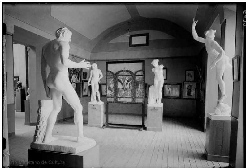
“ Museo de Bellas Artes de Badajoz, sala 3 ”, correspondiente al vestíbulo. Imagen tomada entre 1927 y 1936.