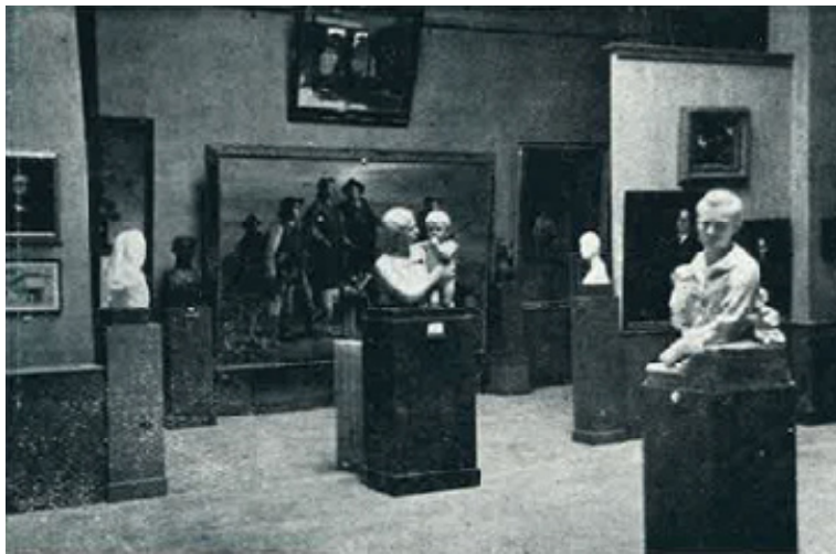
Fig. 8. Salón principal del Museo de Bellas Artes de Badajoz en 1951. Imagen publicada en la revista Mundo Ilustrado , n.º 98, 1951, p. 2.