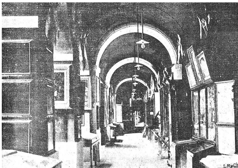
Fig. 1. “Exposición Regional Extremeña, Galería de cuadros y muebles situados en el Palacio de la Diputación Provincial”.

de otro trabajo en breve plazo”, en señal de gratitud por la pensión que disfrutaba 11 desde 1907 12 : un autorretrato donde el artista se acompaña de las herramientas propias de su oficio, realizado en yeso patinado y hoy día expuesto en el Museo.