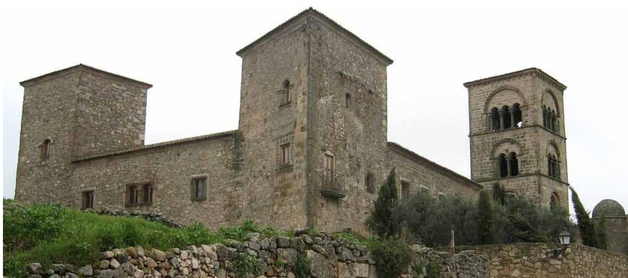
Fig. 1. Palacio Lorenzana de Trujillo, sede de la Real Academia de Extremadura de las Letras y las Artes.

Por lo que a la Real Academia de Extremadura se refiere, no puedo por menos que manifestar el orgullo de haber sido acreedor de la confianza de los miembros de la misma para que sustituyera al tristemente fallecido don José