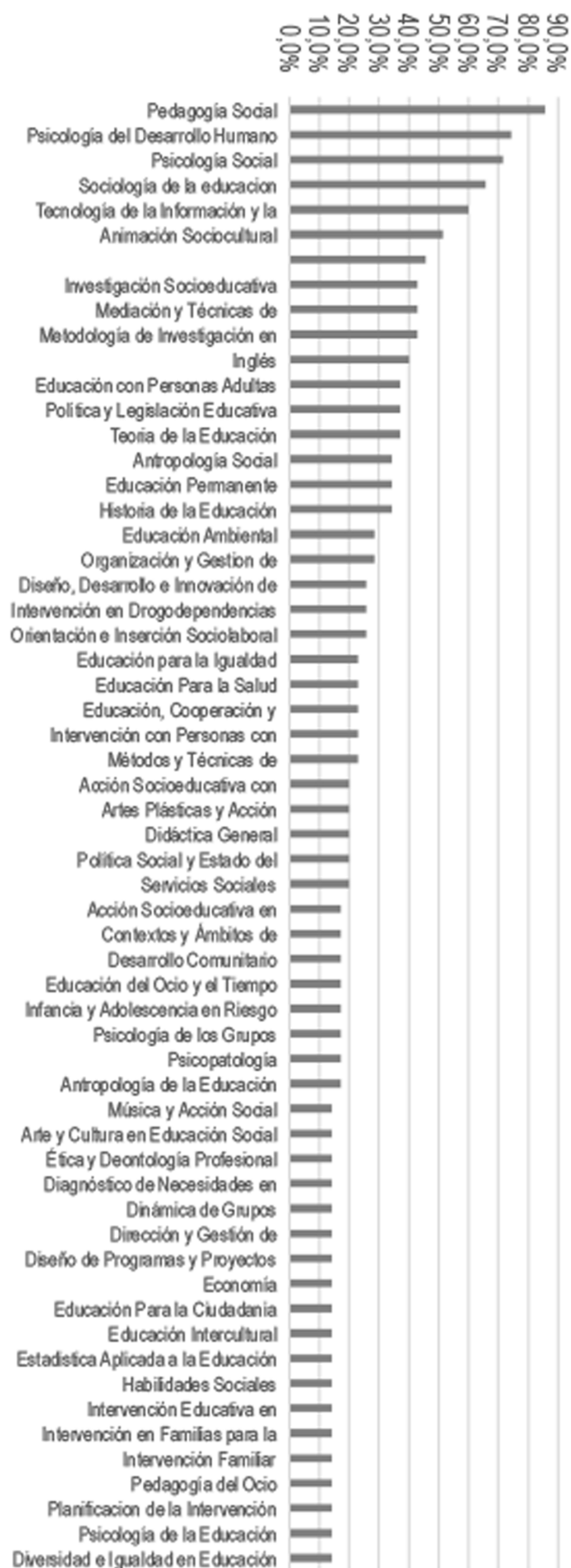
Figura 2. Frecuencia de aparición de grupo de asignaturas en Educación Social: Elaboración Propia.