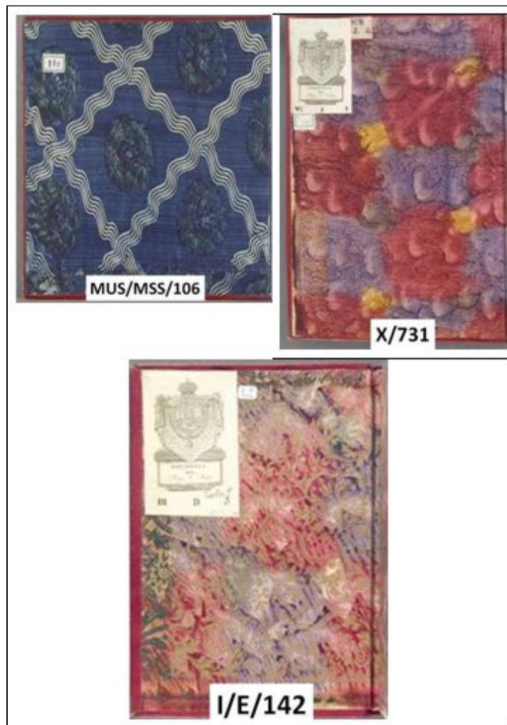
Figura 9. Guardas de papel encolado al engrudo (fuente Real Biblioteca)

En la BEHA a estas guardas se las denomina como de papel brocado para el ejemplar I/E/142 y de papel pintado para los demás.