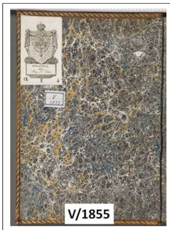
Figura 7. Guardas de papel modelo imperio o Stormont

Los 4 ejemplares de este modelo solo suponen un 2,29 % de los analizados (figura 7) y presentan las características celdillas provocadas por las gotas de trementina añadidas al último color. Es el caso del impreso V/1855, en el que se han depositado gotas de tres colores: ocre, azul y marrón, y a este último se le han vertido las gotas de trementina. Los dos primeros colores forman las vetas por la presión de la trementina añadida al último color, que queda encima en forma de gotas redondeadas divididas en múltiples celdillas en su interior.