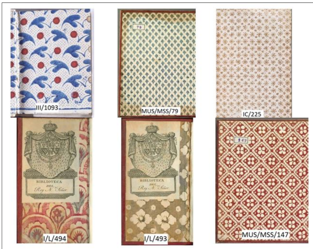
Figura 1. Guardas de papeles xilográficos

En la BEHA las guardas de los anteriores ejemplares aparecen bajo estas denominaciones: