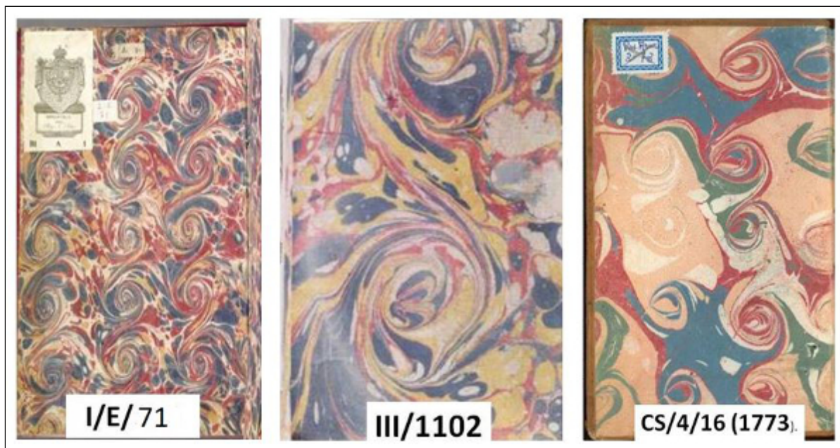
Figura 3. Guardas de papel de espirales

Los papeles analizados suponen el 13,79 % del conjunto estudiado y varían en función del tamaño y disposición de las espirales (figura 3), de tal modo que se encuentran con una disposición regular en hileras (I/E/71), espirales grandes (III/1102), espirales pequeñas (IX/7185), espirales separadas con espacios grandes [CS/4/16 (1773)], espirales juntas (PAS/2780), etc.