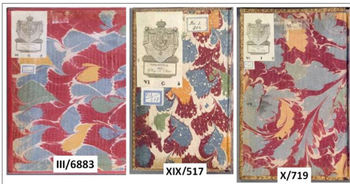
Figura 5. Guardas de papel modelo persillé

En la BEHA estas guardas aparecen bajo las denominaciones de: