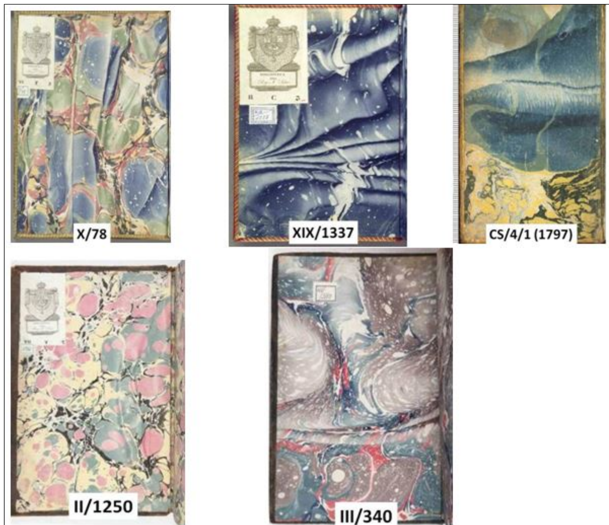
Figura 6. Guardas de papel modelo plegado español

En la BEHA las denominaciones empleadas son las siguientes: