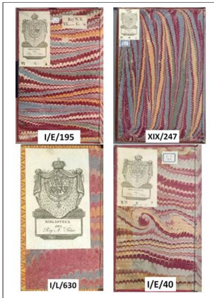
Figura 4. Guardas de papel de peines

Estas guardas se corresponden con ejemplares impresos en España (5 ejemplares), Francia (2 ejemplares), Italia (2 ejemplares) y Bélgica (1 ejemplar). Los impresos de España se incluyen en los reinados de Felipe v (4 libros) y Carlos III (1 libro).