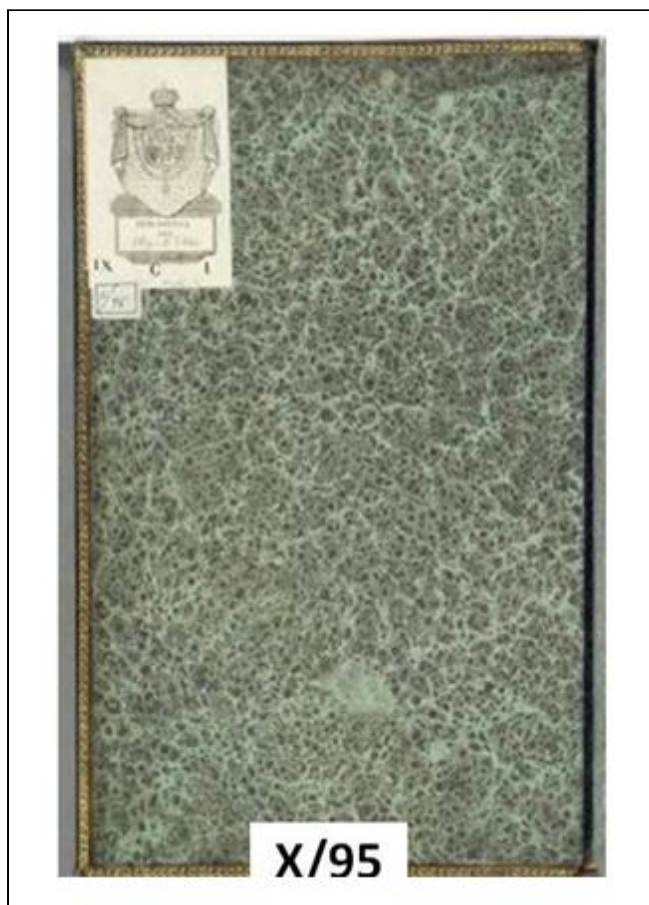
Figura 8. Guardas de papel modelo shell

Los 7 ejemplares identificados de esta modalidad son el 4,02 %. En ellos se aprecia el singular halo transparente alrededor de cada gota de color y que se produce al añadir gotas de aceite de oliva. Como ejemplo se mencionan los ejemplares X/95, II/69 y II/2550, con gotas de color verdoso rodeadas por el halo (figura 8).