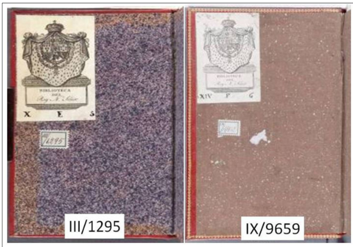
Figura 10. Guardas de papel salpicado

En la BEHA se identifican con las expresiones: