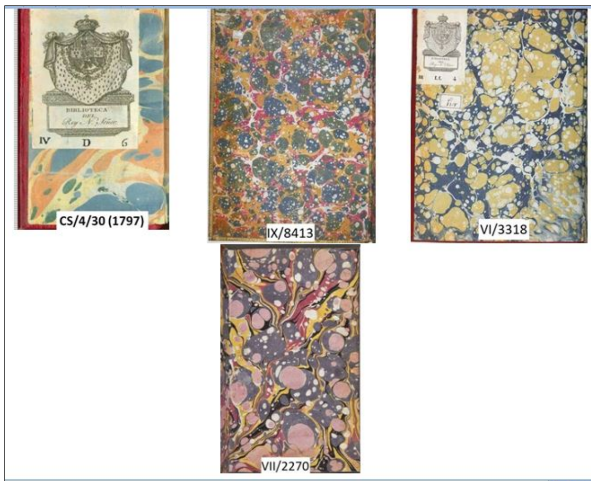
Figura 2. Guardas de papel de gotas o piedras

Del conjunto de los 33 ejemplares identificados se han localizado variantes en función del tamaño de las gotas o del colorido (figura 2), por ejemplo de gotas grandes [I/L/629, CS/4/30 (1797)], de gotas menudas (IX/8413, PAS/2812, PAS/2818), con un color predominante (amarillo: VI/3318, I/L/492; gris: VI/1426), de un llamativo colorido (VII/2270, I/L/636), etc.