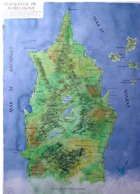
Imagen 1. Península de Burelandia (Ilustración de Enrique Cavestany)

La Península de Burelandia, según el texto escrito que acompañaba a la exposición, fue descubierta por unos navegantes madrileños capitaneados por Don Selenio Telfeusa del Río, protagonista imaginario (como todos los que conforman el universo oparvorulo), representado en la exposición mediante fotografías reales, encontradas en el Rastro madrileño o en otros mercadillos de pulgas y tiendas de antigüedades, personas que existieron y que Enrique Cavestany convirtió en protagonistas de ficción de su propio universo. Para llenar su península inventó un número abundante de personajes: además de Selenio Telfeusa del Río, poblaron el territorio Fermín S. Politos Duncan, la Profesora Homola de Cuvier, Andreas Politos, Romanillos, entre otros muchos bautizados con nombres verosímiles para nuestra propia cultura. Después construyó (casi siempre con materiales reciclados) cientos de objetos, maquetas, dibujos, mapas, pinturas, esculturas, instrumentos musicales, muebles, trajes, naves, balsas, utensilios domésticos, planos de ciudades, un completo herbolario con especies singulares de flora y un original bestiario para representar una fauna mítica de Burelandia 4 , dioses, imagería, máscaras y un curioso sistema de escritura con grafías inventadas ( la escritura oputnia ) que nada tienen que envidiar a los signos alfabéticos aún no descifrados procedentes de algunascivilizaciones antiguas de nuestro mundo.