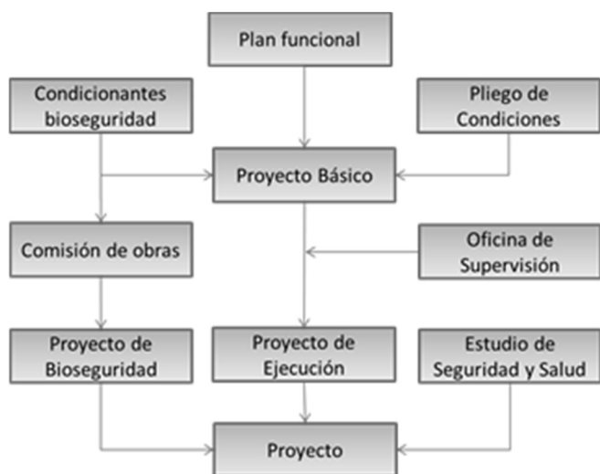
Figura 1. Diagrama de bloques de la metodología utilizada.