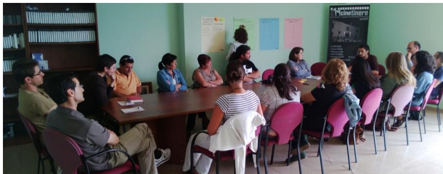
Fig. 7. Mesa de trabajo de Oia (Pontevedra)

Participantes en la mesa de trabajo de Oia: Vecinos del Concello, Asociación Niquelarte, Laboratorio de Patrimonio-CSIC de Santiago de Compostela, Escuela de Restauración de Bienes Culturales de Pontevedra, Oficina de Turismo de Bayona, Concejala de Cultura del concello de Oia, Rock Art Conservation S.L., Comunidad de Montes de Mougás.