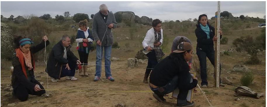
Fig. 1. Primera acción participativa, consistente en una jornada de medición del asentamiento tardo-romano de Los Barruecos, en Malpartida de Cáceres con un trabajo conjunto entre ciudadanos y arqueólogos

El proyecto CINETÍNERE nace de la necesidad social de participación en la gestión del patrimonio cultural. Esa necesidad se viene confirmando en Malpartida de Cáceres desde el año 2012, año en el que UNDERGROUND ARQUEOLOGÍA y el Ayuntamiento de Malpartida de Cáceres comienzan su colaboración con un colectivo ciudadano de la localidad, en un proyecto llamado MAILA, y que tiene como objetivo la puesta en valor del asentamiento tardo-romano del monumento natural de Los Barruecos, de forma colectiva, colaborativa e implicando a todos los ciudadanos del entorno como forma de hacer suyo ese bien patrimonial y poder compartirlo con el resto de la sociedad.