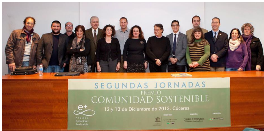
Fig. 16. Representantes de la organización, de los ponentes y de los asistentes a las Jornadas el día de la clausura

hubieran llevado a cabo municipios extremeños durante ese año y que pudieran servir de modelo a otras corporaciones locales.