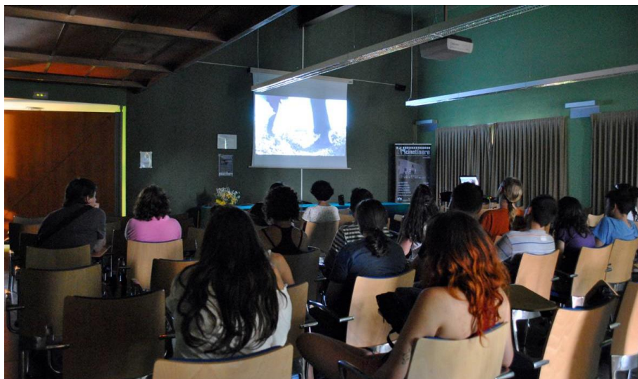
Fig. 2. Proyección en Somiedo (Asturias)

Este ciclo pretendía poner en valor los testimonios de la comunidad perteneciente al entorno rural que son de vital importancia a la hora de conservar usos y tradiciones que en el pasado fueron su medio de subsistencia y que ahora se han convertido en su seña de identidad. Mantener y difundir ese conocimiento puede ser un buen acicate a la hora de generar beneficios para esas comunidades. En definitiva, se ha tratado de mostrar al público cómo se genera conocimiento mediante el uso del formato audiovisual y como mediante ese conocimiento se puede generar nuevos recursos culturales que reporten un beneficio social y económico en el medio rural.