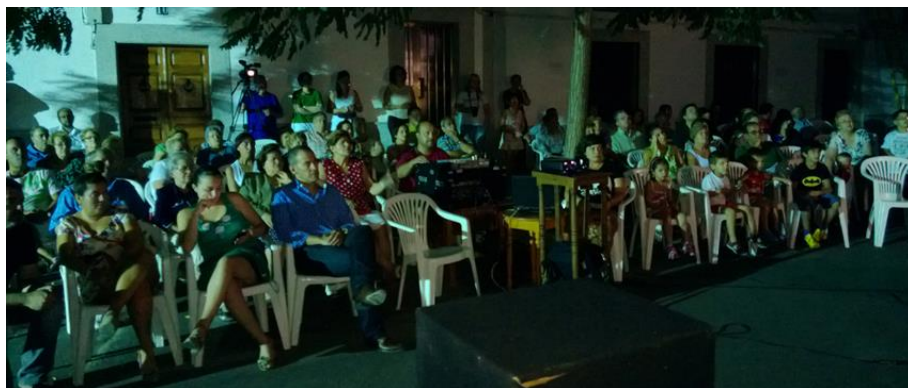
Fig. 3. Proyección en Malpartida de Cáceres (Cáceres).

Estas proyecciones fueron la base audiovisual en la que se apoyaron los talleres y mesas de trabajo.