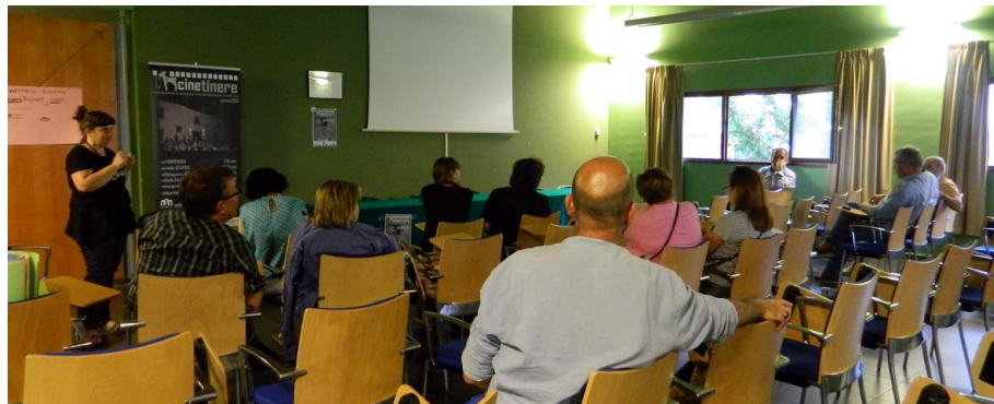
Fig. 8. Mesa de trabajo de Somiedo (Asturias)

Participantes en la mesa de trabajo de Somiedo: Vecinos del Concejo de Somiedo, Ecomuseo de Somiedo, Asociación Cultural La Ponte.