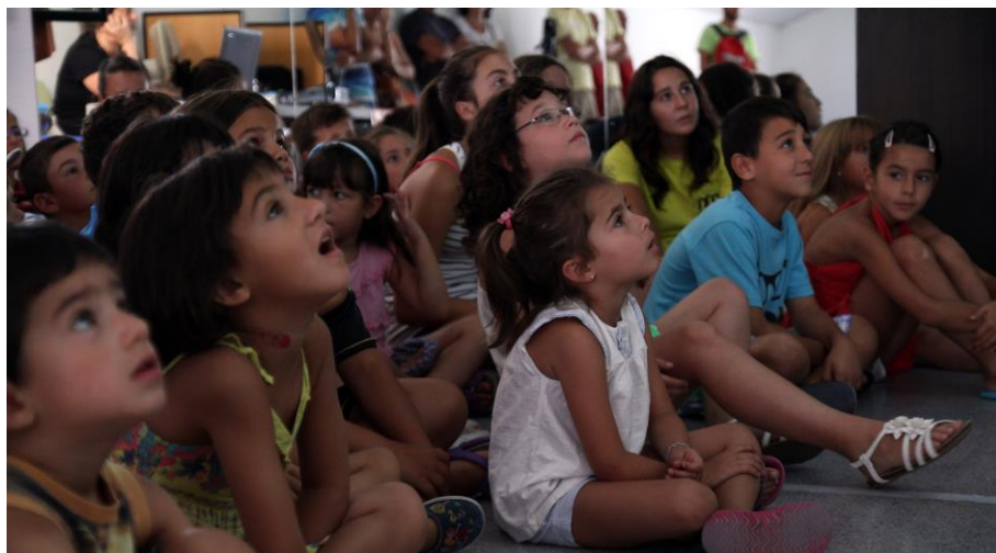
Fig. 4. Taller didáctico de Malpartida de Cáceres (Cáceres)

En todas las localidades se han realizado dos talleres didácticos dirigidos a niñas y niños de entre 6 a 12 años. Para facilitar la asistencia se ha tenido la colaboración de los diferentes ayuntamientos que han participado en la comunicación facilitando el acceso de la programación de los mismos a los ciudadanos. Pese a que se plantearon para un rango de edad restringido, finalmente acudieron niños de más edades, sobre todo de los más pequeños, que venían acompañados de sus padres, que en algunos casos también participaron en la actividad. Creemos que, aunque no estaba planificado así, es importante que los padres participen de este tipo de talleres ya que ayudan a sus hijos a reafirmar sus conocimientos y a mantener su interés en temas relacionados con el patrimonio... y viceversa, ya que también nos sirve para introducir a los padres en este tipo de dinámicas y poder desarrollar con ellos otro tipo de acciones.