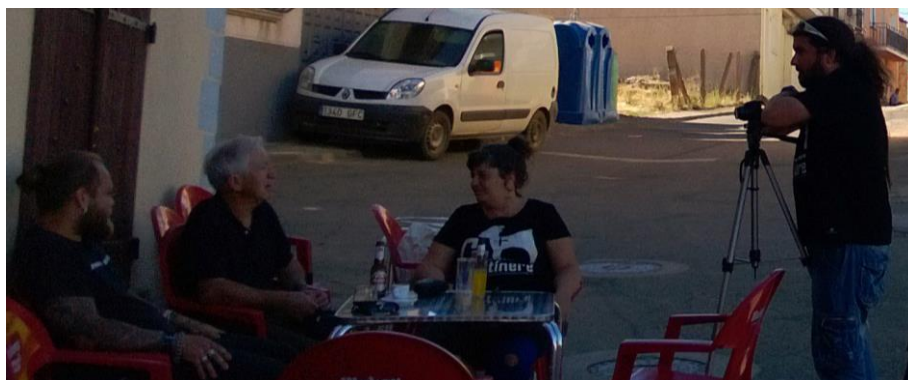
Fig. 10. Mesa de trabajo de Robleda (Salamanca)