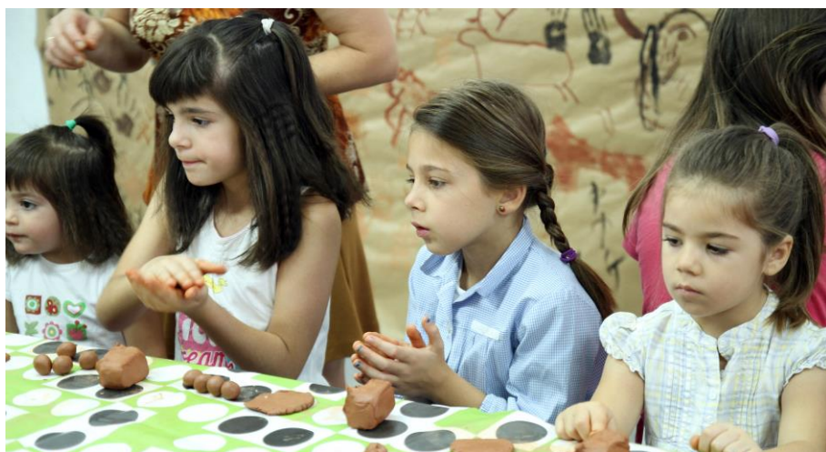
Fig. 6. Taller didáctico en Malpartida de Cáceres (Cáceres)

La participación en los talleres didácticos fue muy positiva y multigeneracional, ya que al sacar el conocimiento de las aulas, como hemos comentado anteriormente, los familiares pudieron participar de los mismos.