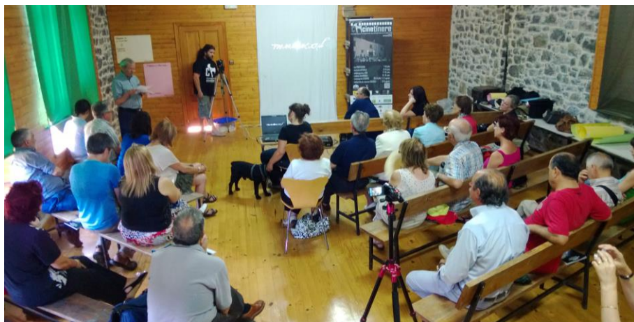
Fig. 9. Mesa de trabajo de Valdelgueros (León)