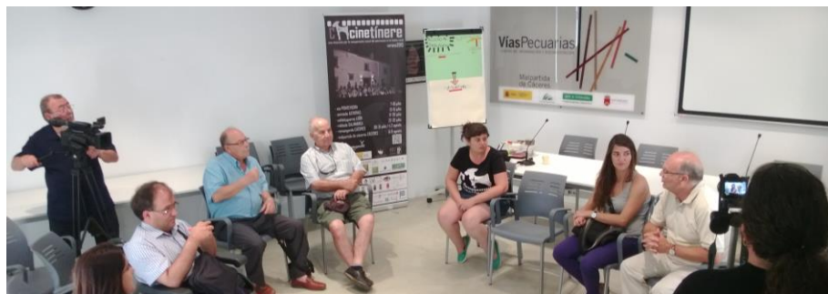
Fig. 12. Mesa de trabajo de Malpartida de Cáceres (Cáceres)

resultados se hicieron patentes en el sOpA'13, en el que participaron muchos de los grupos de las diversas mesas de trabajo.