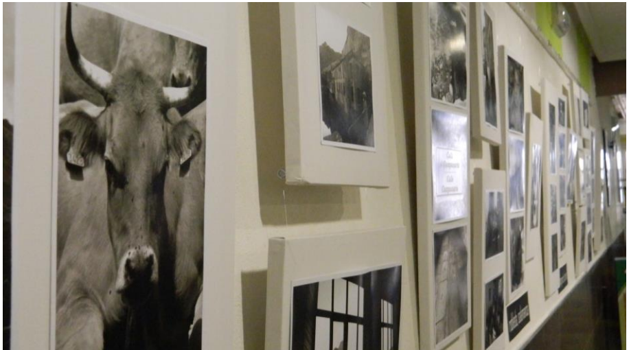
Fig. 15. Exposición fotográfica sobre Cinetínere en la pastelería Milhojas de Malpartida de Cáceres.

Exposición fotográfica ARRETRATAÚRAS: momentos de un paseo por el rural : La exposición, celebrada en la panadería-pastelería MILHOJAS, de Malpartida de Cáceres entre los días 13 y 30 de septiembre de 2013, recogió las imágenes más significativas de la itinerancia del proyecto, no solo de las actividades desarrolladas, sino también de aquellos elementos singulares que propiciaran un conocimiento por parte de la población de Malpartida de las diferencias espaciales y culturales entre unos territorios y otros.