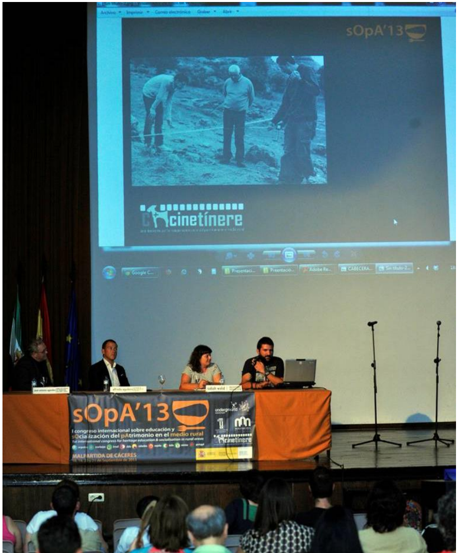
Fig. 13. Presentación de los resultados del Proyecto CINETINERE en el Congreso sOpA'13