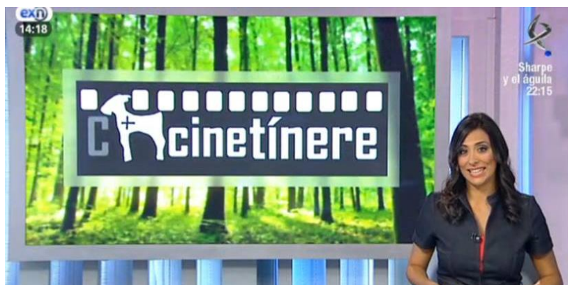
Fig. 14. Cinetínere en Canal Extremadura

http://www.malpartidatelevision.es/index.php/video/236/informativo-semanal-53 (a partir del minuto 23'50").