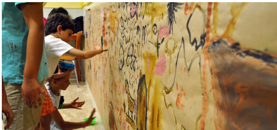
Fig. 5. Taller didáctico en Romangordo (Cáceres)