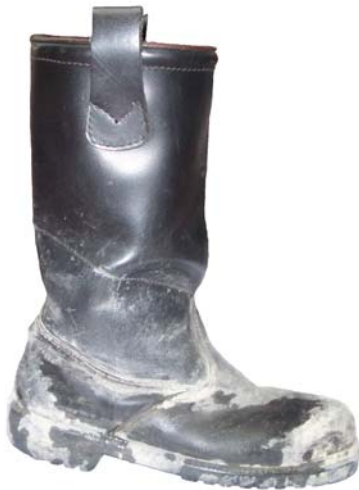
Figura 1. Botas de bombero Elten – Sichezheitsschule Scharz ©.

Los registros se realizaron en dos condiciones de marcha. El orden de registro entre las condiciones de marcha se realizó de forma aleatoria (Esenyel, Walden, Gitter, Walsh, & Karacan, 2004; Oeffinger, et al., 1999). La condición I correspondió la marcha con las botas de bombero Elten – Sichezheitsschule Scharz © (figura 1) y la condición II correspondió a la marcha con calzado de cuero Clinic © sin caña (figura 2).