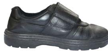
Figura 2. Calzado de cuero Clinic © sin caña.