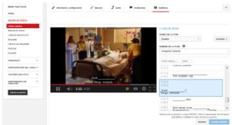
Figura 1. Clip Hospital Central

Con esta propuesta de tarea pretendemos crear, por tanto, un entorno real donde los alumnos puedan desempeñar un papel activo en el aula, el cual nos viene marcado por la subtitulación. De esta manera, creemos que el alumno “aprende haciendo” tal y como se plantea en el TBL ( Task-Based Learning ) (Talaván, 2013: 19).