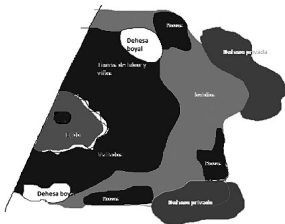
FIGURA 3 ESQUEMA DE LA MODIFICACIÓN DEL TERRAZGO EN EL TÉRMINO DE MÉRIDA

en los extremos del término (Arroyo y Almendralejo contra Solana, La Nava o las Herrerías), los de Montijo cuando iban a estos mismos últimos lugares o los de Los Santos cuando se desplazaban hasta las tierras que labraban en término de Almendralejo, por poner algunos ejemplos (Fig. 3).