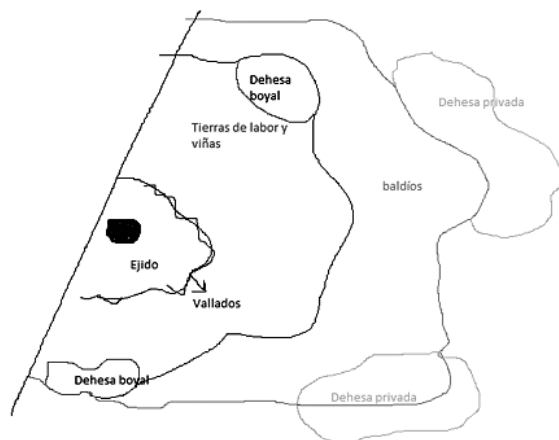
FIGURA 2 ESQUEMA DE LA ORDENACIÓN CLÁSICA DEL TERRAZGO EN EL TÉRMINO DE MÉRIDA

Más allá, hacia los extremos, en los montes y sierras y allí donde la reja y el arado no habían llegado aún, se extendían los baldíos, todos ellos de uso comunal, cuyos aprovechamientos estaban regulados por las ordenanzas municipales y que fueron objeto de expansión para la agricultura cuando se fueron necesitando, dando lugar a un paisaje natural salpicado de rozas y tierras de labor en lugares muy alejados de los núcleos poblados, lo que contribuyó a desdibujar un paisaje rural típico, herencia de los pobladores venidos del norte, que en esta zona, y como consecuencia de la amplitud de términos existentes, extendió el paisaje agrario hacia los extremos mezclado con el bosque, rompiendo el clásico esquema de anillos concéntricos 29 .