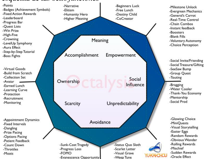
Imagen del esquema de las ocho funciones