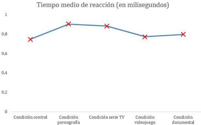
Figura 1. Tiempo de reacción durante la tarea Stroop en las distintas condiciones

Asimismo, se llevó a cabo una comparación Bonferroni post-hoc a fin de comparar las condiciones por pares y ver entre qué condiciones las diferencias eran significativas. Así, se encontró que los tiempos de reacción eran significativamente superiores durante la condición de pornografía respecto a la control ( p<.001 ), la de videojuegos ( p<.001 ) y la de bajo contenido multimedia ( p<.001 ), pero no la de series de televisión ( p=.394 ).