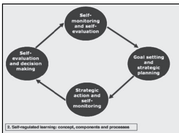
Fig. 2: Componentes del aprendizaje autorregulado (Torre, 2007)

Otra perspectiva futura es la implementación y el estudio del efecto del programa CIP en otras poblaciones, por ejemplo, en niños o en mayores. En estos últimos, también realizamos un estudio piloto (Franco, Autor, 2012), y constatamos que puede ser muy interesante trabajar en la mejora de habilidades cognitivas y emocionales con las técnicas de la llamada Revisión de vida (Serrano et al., 2011).