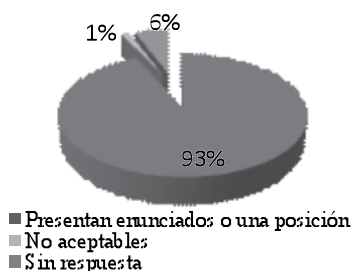
Figura 1. Nivel 1 de competencias argumentativas.

En el nivel 2 que corresponde a los alumnos que muestran la competencia de contraargumentar, se encuentra más de la mitad de la muestra (gráfica 2). Casi la totalidad de los alumnos que no respondieron a los ítems relacionados con este nivel, o que si respondieron pero sus respuestas no fueron aceptables (no válidas), son los identificados en el nivel 1. Los sujetos situados en el nivel 2 de mayor complejidad argumentativa, son capaces de utilizar contraargumentos, esto es; de imaginar posiciones distintas de las propias ante cualquier situación controvertida.