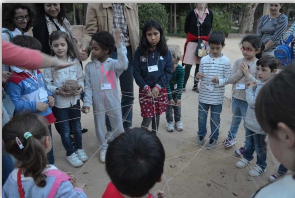
FIGURA 6. Actividad: “La Madeja de la Historia”.

Además, a partir de la simbología de la madeja y las conexiones establecidas, nos sirve para ver de forma visual cómo todo está relacionado, siendo la naturaleza parte de nuestra historia y por tanto parte de nuestro patrimonio.