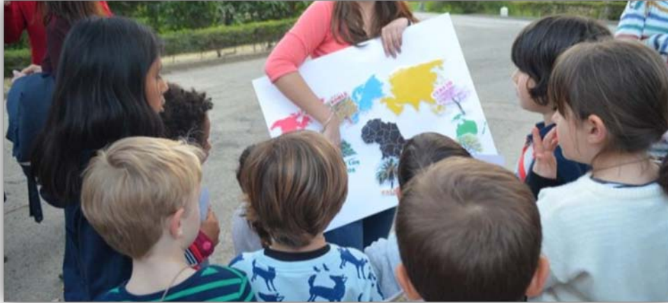
FIGURA 4. Actividad: “El árbol de las lianas”.

procedencia, y no solo por la de este árbol sino por todas las de los árboles y plantas del parque. En esta actividad conocerán más especies alóctonas que tenemos en el parque, y para ello, se les facilitará unas pistas que deberán buscar con la misma dinámica que las de la anterior actividad. A su regreso cada grupo explica a los demás compañeros/as las características del árbol y su procedencia. Por tanto, finalmente formamos un mapamundi con la procedencia de cada uno, su dibujo y su nombre (FIGURA 4).