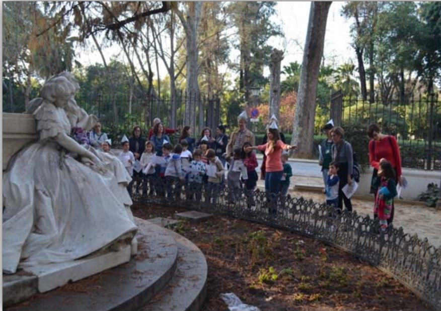
FIGURA 2. Actividad: “Monumento a Bécquer”.

Una vez con los equipos hechos, se comienza con la primera actividad de desarrollo diseñada ( “El monumento a Bécquer” ). Para ello, los participantes tienen que observar el monumento de la Glorieta de Bécquer para dar respuestas a las cuestiones formuladas (FIGURA 2).