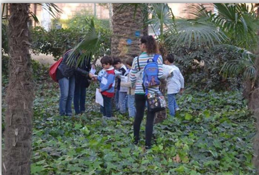
FIGURA 3. Actividad: "Las Palmeras".

Una vez contrastadas todas estas diferencias se les facilita los sobres que contienen las pistas a seguir para descubrir más información sobre las palmeras. Un miembro del grupo lee la pista en voz alta y cuando deciden a que palmera se refiere la pista y dónde deben buscar, corren hacia el lugar (FIGURA 3). Cuando vuelven con las pistas resueltas se pone todo el material en común y se configura una línea cronológica del ciclo vital de las palmeras.