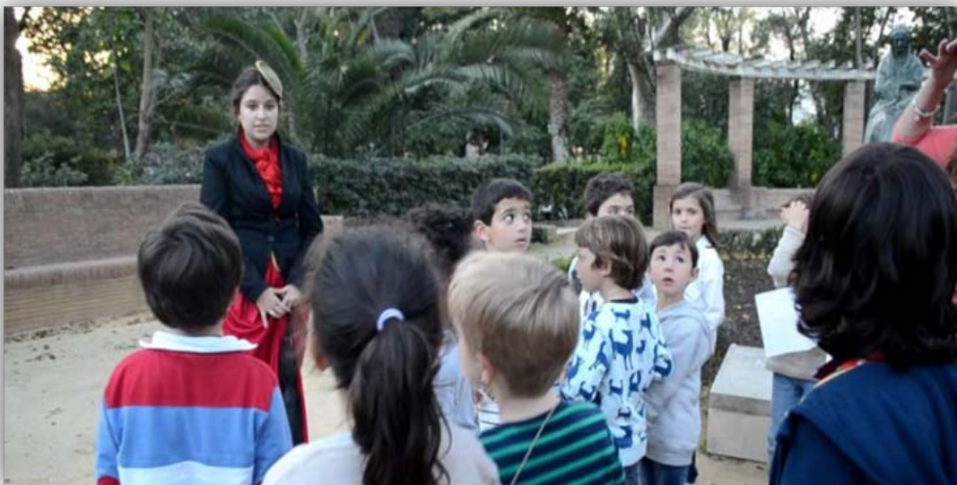
FIGURA 5. Actividad: “¿Quién es María Luisa?”.

En el último lugar del corrido se realizarán las dos últimas actividades, la primera nos ayudará a conocer los orígenes del parque y de su característico nombre (“¿Quién es María Luisa?”). Se dirigen hacia el monumento María Luisa, quien da nombre al parque, donde se realizará una pequeña escenificación teatral, desarrollada por dos personajes, que pretenden dar a conocer las diferencias entre la vida en siglo XIX, época de “María Luisa” y nuestra época actual. Los niños y niñas participan en el teatro y se reviven escenas cotidianas de ambas épocas (FIGURA 5). Esta es la última actividad de desarrollo del Itinerario Didáctico, se puede ver en video en el siguiente enlace: https://www.youtube.com/watch?v=OArBXXvXngw