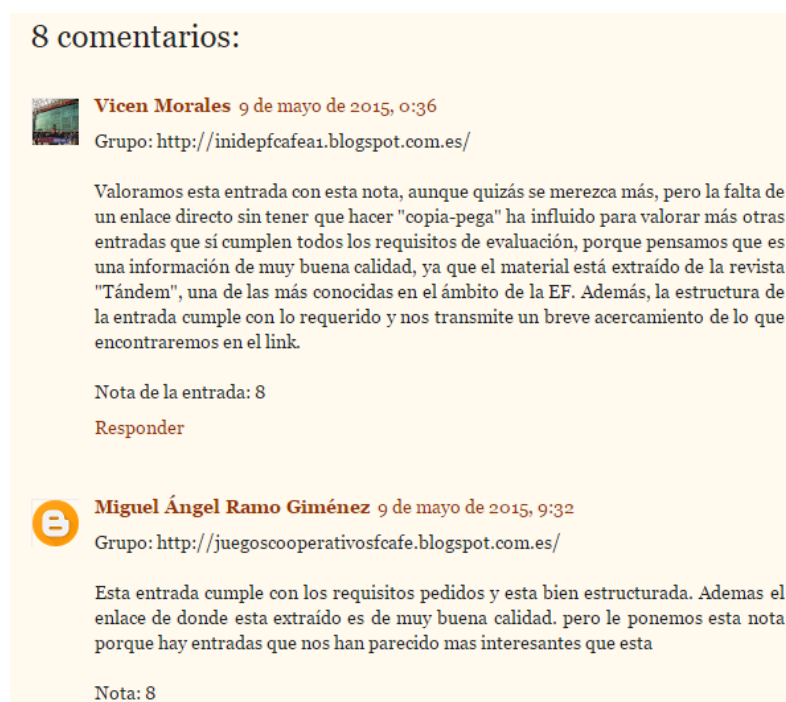
Figura 2. Ejemplo de evaluación de uno de los recursos digitales alojados en uno de los blogs temáticos.

Una vez que todos los grupos evaluaron cuantitativa y cualitativamente cada uno de los recursos digitales, se realizó un volcado de la información que permitió tener un ranking de los mejores recursos digitales de cada contenido clave de la asignatura. Además, con esa información se creó un material curricular interactivo que contiene los diez mejores recursos de cada contenido ( https://goo.gl/maQ7T2 ).