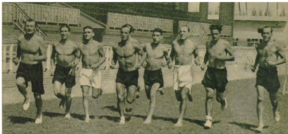
Imagen 1. “El footing enérgico bajo el sol con medida, es un buen ejercicio para eliminación de peso inútil acumulado durante el descanso veraniego”. Jugadores del Valencia FC entrenados por Greenwell.

A pesar de todo, la preparación física del fútbol en los años treinta experimentó un cambio importante. Los jugadores eran más atléticos, no sólo rendían más, también jugaban mejor. La condición física era un aspecto a destacar, tanto es así, que la prensa deportiva empezó a prestar interés de cómo se preparaban físicamente los equipos. Fijándonos en el diario As (Madrid), comprobamos cómo las noticias de los entrenamientos ocupan un espacio importante, sobre todo al principio de la temporada. Así, aparecían crónicas sobre cómo se preparaban algunos de los mejores equipos de la Liga. En estas crónicas se dejaba sentir la influencia de una preparación, principalmente basada en ejercicios atléticos, la gimnasia sueca y, también, aparecían las carreras llamadas footing (Imagen 1). Observando las imágenes comprobamos cómo se seguía un estilo de enseñanza basado en el mando directo, es decir, unas formas de dirigir las sesiones bajo la autoridad técnica del entrenador, el cual imponía una disciplina prácticamente militar.