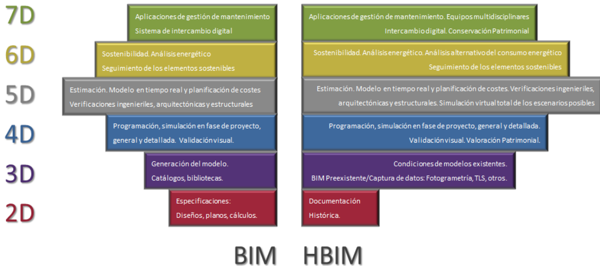
Figura 1: Representación de 7D BIM vs. 7D HBIM

La Figura 1 es un resumen de las siete dimensiones de BIM tal como se han definido hasta ahora [1] frente a nuestra propuesta para HBIM. La longitud de cada barra define la importancia que cada dimensión tiene dentro de BIM / HBIM.