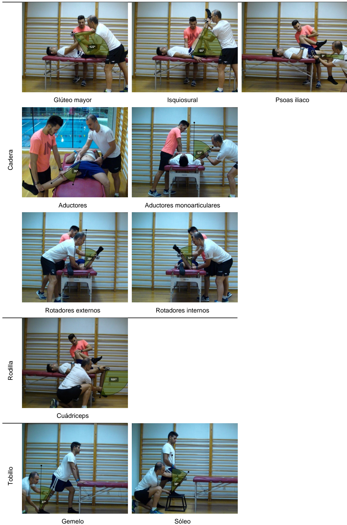
Figura 1. Representación gráfica de las 10 pruebas de valoración del rango de movimiento pasivo máximo del protocolo "ROM-SPORT".